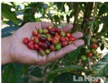
Gestión. Se busca dar impulso al café ecuatoriano en el exterior.

Representantes cafeteros del país buscan que se reactive la producción para poder competir en el exterior. Según información de Proecuador, los principales mercados para el producto nacional en los últimos cinco años han sido Colombia, Alemania, Polonia y Rusia.